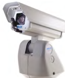
Aluminio Anodizado presurizado