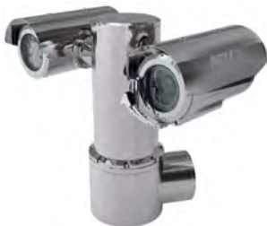
Acero inox. antideflagrante